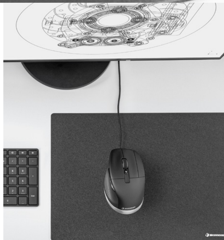
CadMouse Pro, CadMouse Pad

Für Details über unterstützte Anwendungen besuchen Sie bitte unsere Website oder kontaktieren Sie uns direkt.