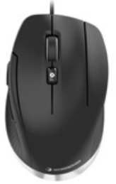
CadMouse Pro Wireless