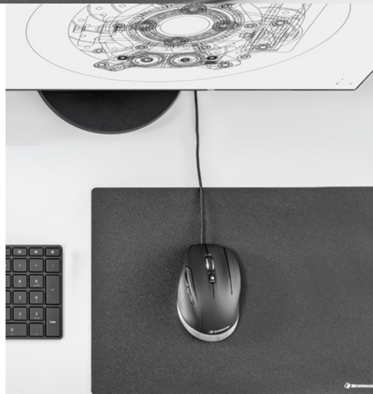
CadMouse Compact, CadMouse Pad

Für Details über unterstützte Anwendungen besuchen Sie bitte unsere Website oder kontaktieren Sie uns direkt.