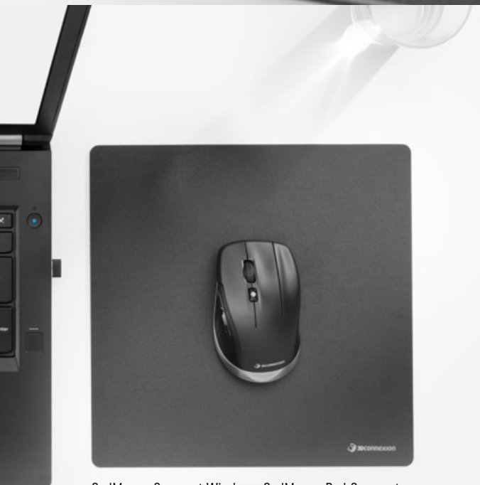
CadMouse Compact Wireless, CadMouse Pad Compact

Dedizierte mittlere Maustaste – der Klick mit dem Mause rad gehört dank intelligentem, ergonomischem Design der Vergangenheit an.